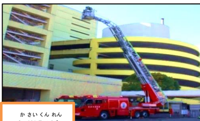
かさいくんれん 火災訓練