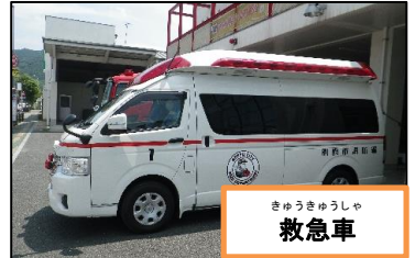
きゅうきゅうしゃ 救急車