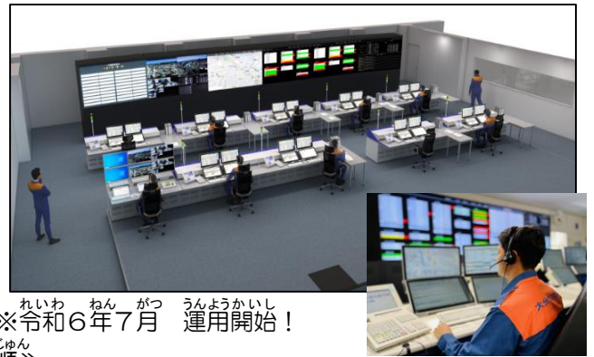
※令和6年7月 運用開始！