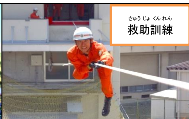
きゅうじょうくんれん 救助訓練