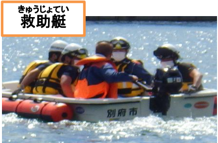
きゆうじよてい 救助艇