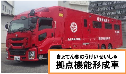
きよてんきのうけいせいしや 拠点機能形成車

近年、日本各地で大きな地震などの災害が発生しています。災害は多様化しているため、対応するにはあらゆる消防自動車などや資機材が必要になってきます。別府市消防本部では、主な消防自動車など以外に、次の装備も備えています。