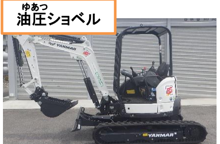
ゆあつ 油圧ショベル