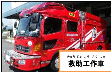
きゅうじょうさくしゃ 救助工作車