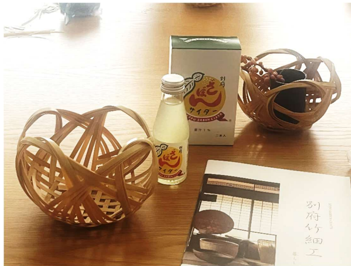
素敵な花籠が無事完成し、別府ざぼんサイダーで乾杯！

「集中して時間が経つのがあっという間でした」と皆さんとても楽しまれている様子でした。