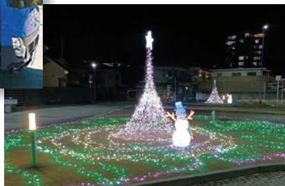
▲亀川駅のイルミネーション