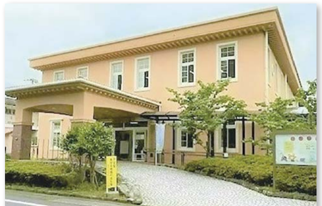
▶北部コミュニティセンター改修工事