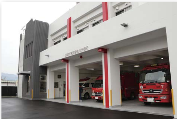
◀消防署亀川出張所建替工事