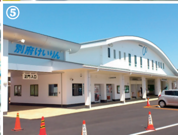
① レースの様子。② 選手が入場する「闘門」。③ 初心者ガイドダンスコーナー。④ 特別観覧席。⑤ 別府競輪場の外観。