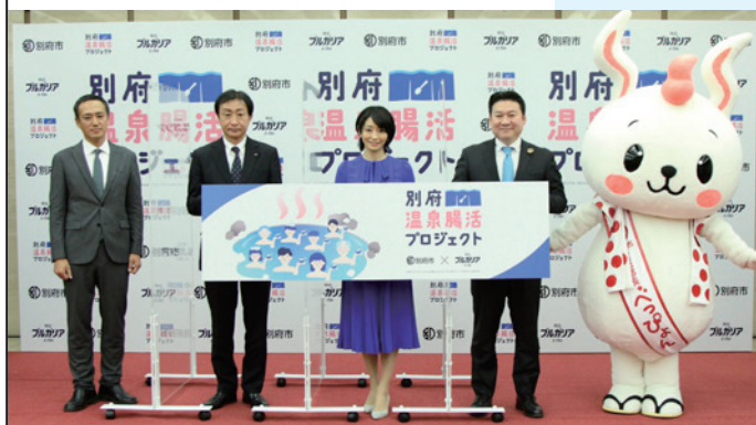
プロジェクト発表会の様子

別府市と株式会社明治は、温泉と明治の主要商品である「明治ブルガリアヨーグルト」※による、新・おなか健康習慣『別府 温泉腸活プロジェクト』を開始しました。