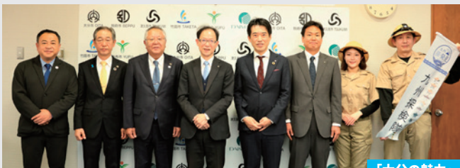
「大分の魅力」を 県外にアピール！

「九州探検隊」は、(株)博多大丸が九州・沖縄119市の行政と協力して情報を収集・発掘し、その情報を広く紹介することによって九州全体の活性化を目指す地域社会との共生プロジェクトです。このたび、「九州探検隊」を各市の情報発信アンバサダーとして、大分都市広域圏の大分市、別府市、津久見市、竹田市、由布市がともに認定をしました。