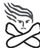
女性に対する暴力根絶のためのシンボルマーク

夫・パートナーからの暴力(DV:ドメスティック・バイオレンス)、交際相手からの暴力(デートDV)、セクハラ、ストーカー行為、売買春、性犯罪、人身売買など女性に対する暴力は女性の人権を侵害するものであり、決して許されるものではありません。あなたやあなたの親しい人が誰にも言えずに悩んでいることはありませんか?下記相談窓口では、女性のあらゆる悩みに対応しています。ひとりで悩まず、まずは相談窓口にご相談ください。