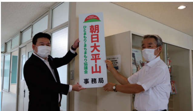
地 域活動の拠点として—8月31日、朝日大平山ひとまもり・まぢまもり協議会の「事務局開所式と防災訓練」が行われました。事務局の開所は市内7協議会の中で初めてとなり、地域の課題解決に向けた活動の拠点として使用されます。