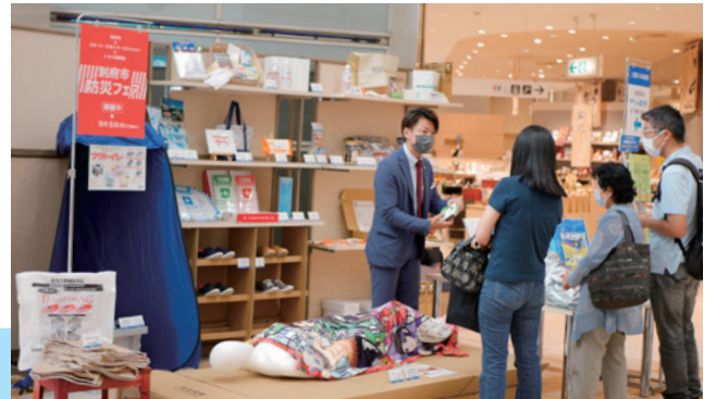
防 災意識の向上—9月4日から2日間、トキハ別府店で「別府市防災フェア」を開催しました。訪れたお客さんは、防災バッグや備蓄用品などを手に取り、災害に備えるために必要なものをそれぞれ購入していました。