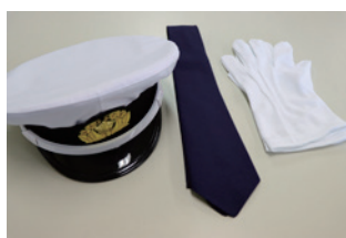
▲指導時に着用する制服などは貸与します

募集校区 南小、南立石小、石垣小、朝日小、大平山小 報酬 10万円(年額) 指導時間 授業日の7時30分～8時30分(約1時間)