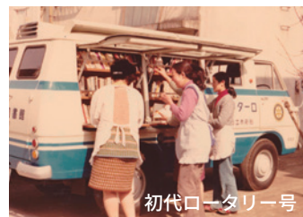
初代ロータリー号

巡回はA～Jコース・東山の計11コースです。日程は毎号の「図書館からのお知らせ」をご覧ください。(今月号は23ページへ)