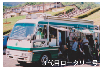
3代目ロータリー号