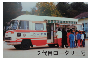
2代目ロータリー号