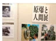
▲パネルのイメージ

証言を組み合わせて制作された「証言パネル」です。地域や学校での平和学習などに活用してください。