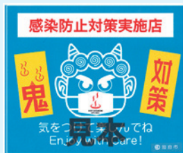
▲鬼コロナ対策ステッカー