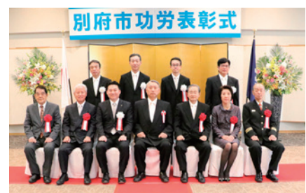
▲令和元年度別府市功労表彰式の様子