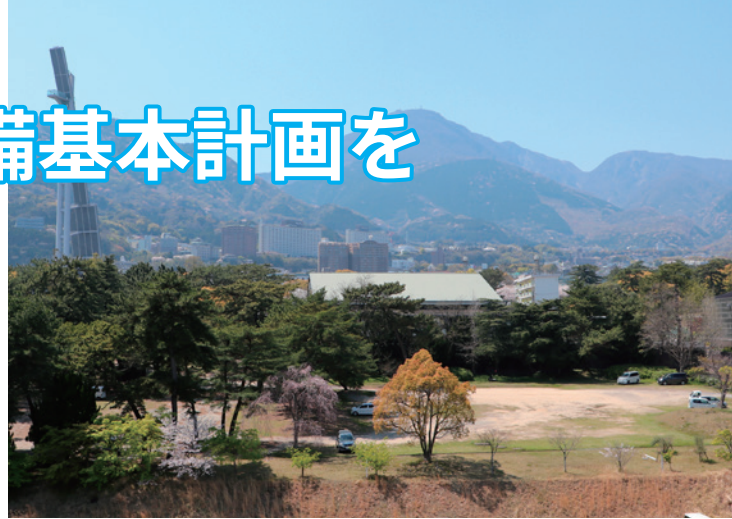
▲建設予定地の別府公園文化ゾーン