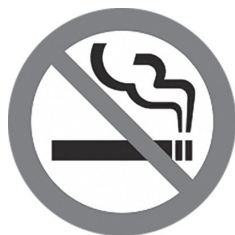
多くの施設において 屋内が原則禁煙に