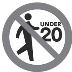
20歳未満の方は 喫煙エリアへ立入禁止に