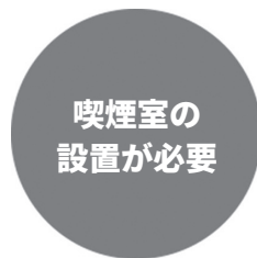
屋内での喫煙には 喫煙室の設置が必要に