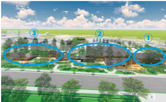
※コモンズ…「みんなの居場所」