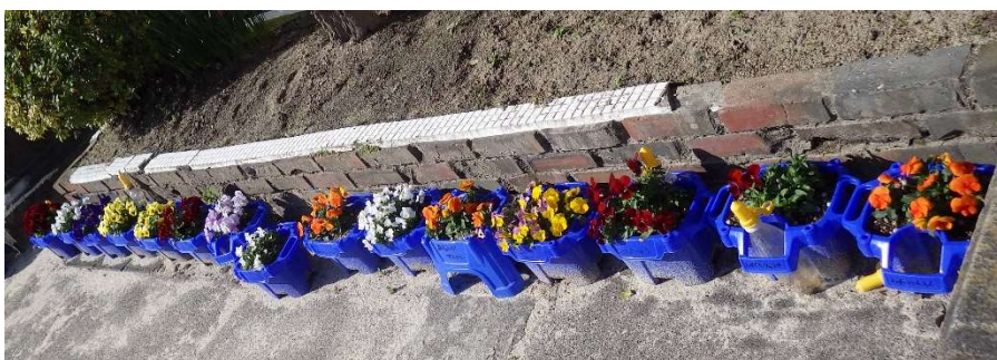
(色とりどりのヴィオラの花たち)

1年生が育てたヴィオラと飼育・栽培委員会が育てラナンキュラスは、卒業式や入学式の会場周りを飾る予定です。