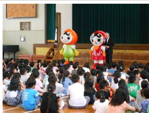
(激励の言葉をいただきました)

交付式後，ゲストの「じんけんまもるくん・あゆみちゃん」とハイタッチをして，交流していました。また，前年度に取り組んだ大分市立三佐小学校から，メッセージボードと活動の様子を知らせるフォトボードもいただきました。スローガンを掲示し，本校舎玄関に飾りました。