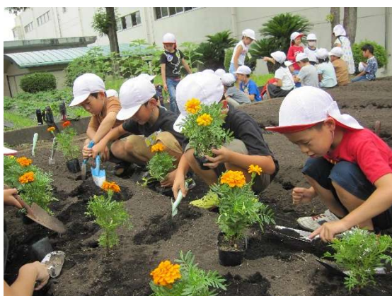
(支え合って植えていました)