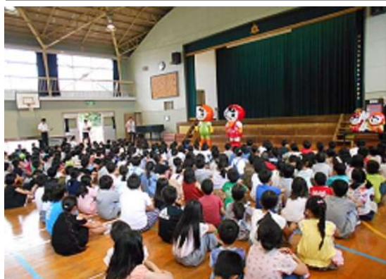
(二人を拍手でお迎えしました)

花の苗をいただきありがとうございました。いただいた花の苗一つひとつに，大切な命があります。飼育・栽培委員を中心に，みんなで大切に育てていきます。みんなで支え合って咲かせたきれいな花を見て，全校のみなさんや学校に来てくれた人たちが，「きれいだな。」と思って，笑顔になってもらえるとうれしいです。一生懸命育てます。