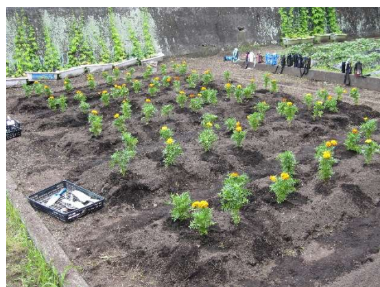
(全部植え終わり、華やかになりました)