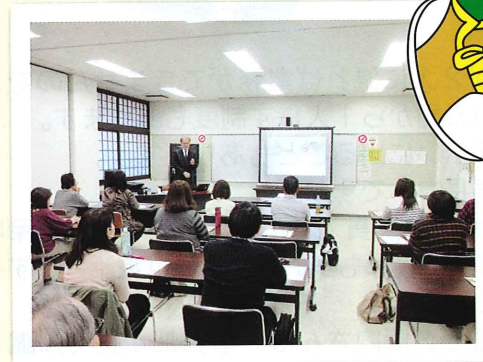
生命保険の基礎知識