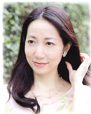
講師 佐久間 レイ さん

[マフラーちゃん]ごっこ (とっこハム太郎) 無条件に受け止める 愛 情。 やさしい言葉をたくさん言う。 その言葉は、相手だけでなく自分にもかえってくる。