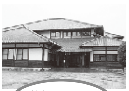
竹細工 伝統産業会館