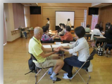
消防本部による講義