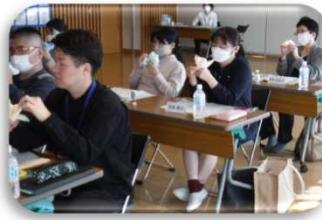
【手作りおもちゃ製作】