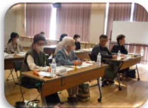
【管理栄養士の講義】

令和5年10月11日・25日、11月17日に令和5年度 第2回まかせて会員養成講習会・再講習会を開催しました。地域に住む子育て中のご家庭をサポートするため3日間の講習を受講し、6名の方が新しくまかせて会員とられました。これからどうぞよろしくお祈りします！