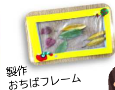
製作 おちばフレーム