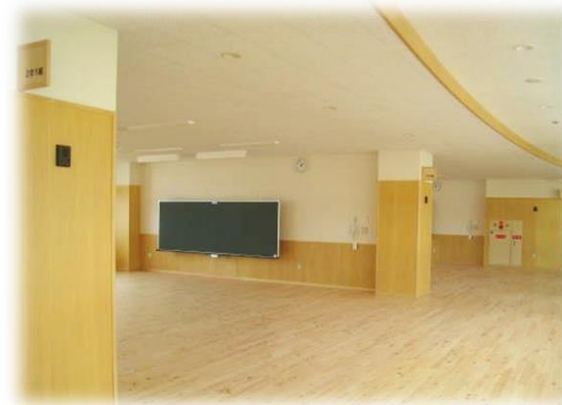
ワークスペースと教室