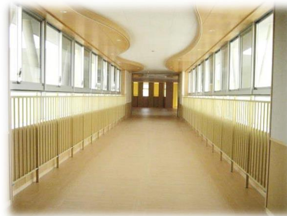
東教室棟と昇降口棟を結ぶ連絡通路