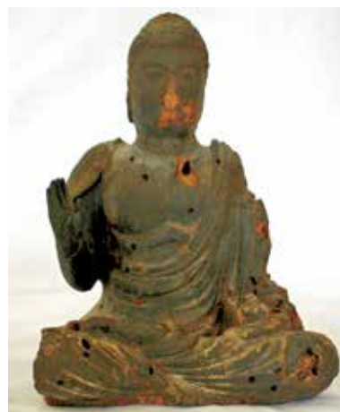
9. 浜脇薬師堂・薬師如来坐像

薬師堂本尊薬師如来坐像(写真9)は、像高16.3cmの小像であるが、そのわりに小ささを感じさせない堂々とした量感が表されている。両胸と腹部のくびれを明瞭に表し、厚みのある体貌、張りのある両膝、そして何よりも両肩から腹前・両膝に流れる鋭い衣文表現など、9～10世紀頃の平安前期彫刻の名残を見せている。虫喰い、朽損が著しいのが惜まれる。