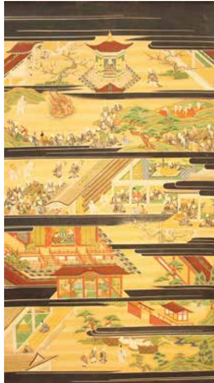
19. 親鸞聖人絵伝 第4幅