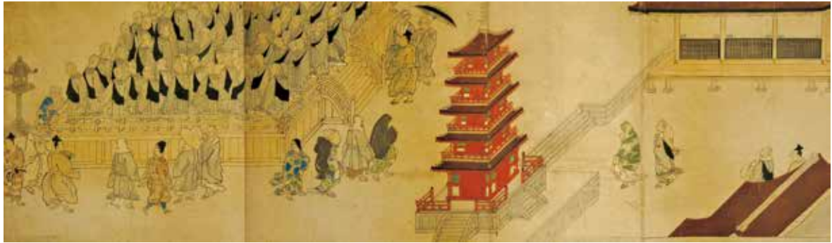
15. 永福寺・遊行上人縁起絵