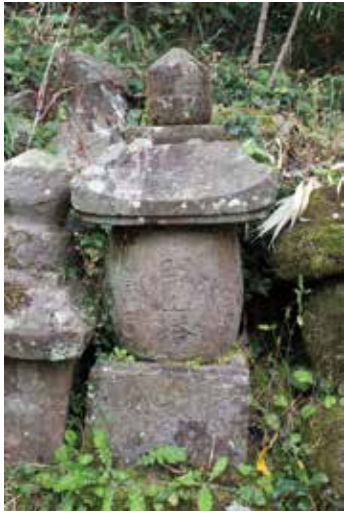
21. 松音寺 開山宝塔