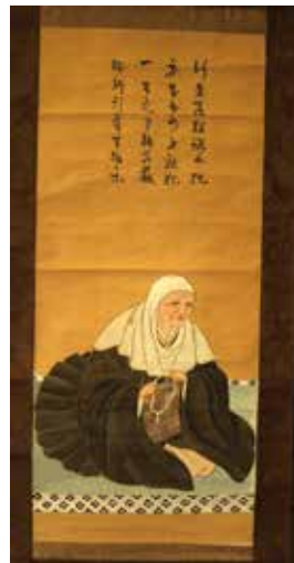
26. 永福寺 恵信尼画像