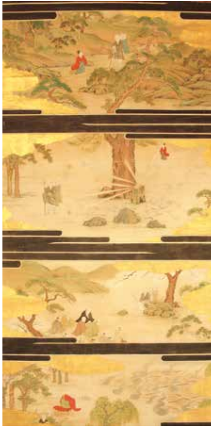
12.曹源寺・三国伝来観世音像八幡大神影嚮図 第1幅