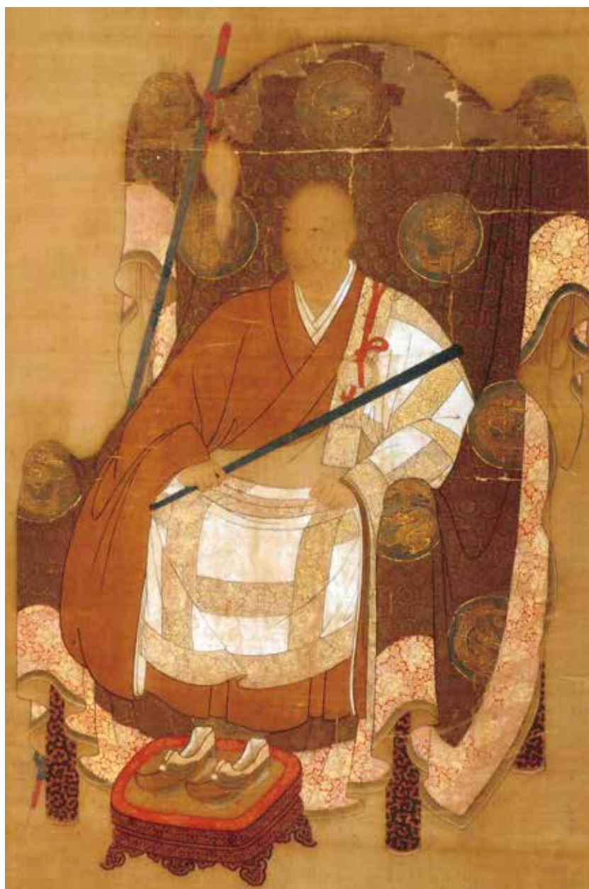
別府市指定有形文化財「絹本着色雪村友梅像」