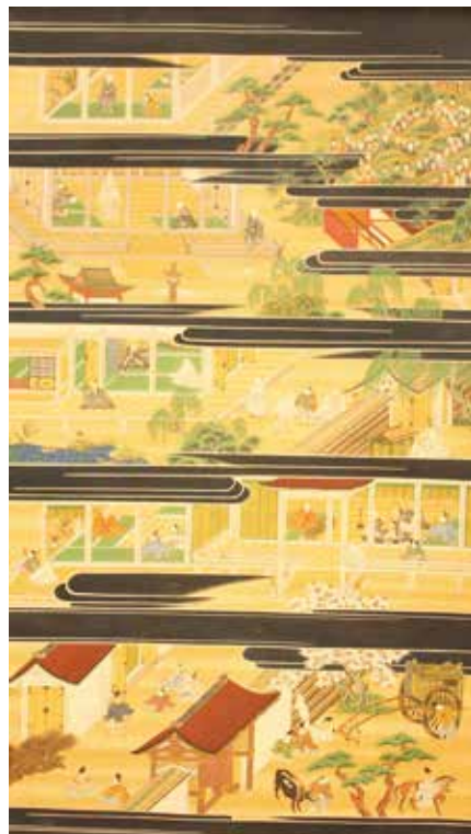
16. 西念寺・親鸞聖人絵伝 第1幅

それぞれ丹念に描き込まれる。水面には白線で細やかな波紋が描かれ、輿や牛車、着衣などの文様表現も緻密である。龍や山水が描かれた画中画も丁寧に描き込まれ、細部の装飾表現が見事である。