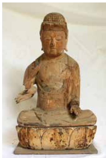
29. 西念寺 阿弥陀如来坐像