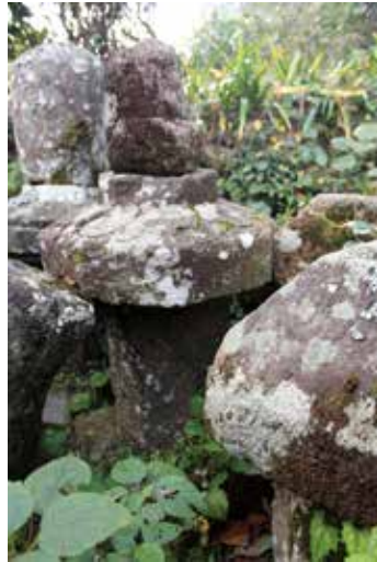
22. 松音寺 無縫塔①