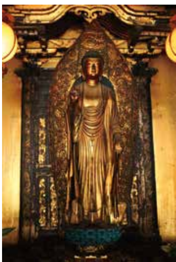
28. 永福寺 阿弥陀如来立像