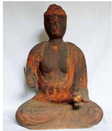
6. 長泉寺・薬師如来坐像

薬師如来坐像（写真6）は、像高59.2cm、木組みはきわめて古式で、両肩を含めて頭・体共木の一木造からなり内刳りもない。朽損のため目鼻立ちは不明瞭だが、胸腹部の膨らみは明瞭で、両肩から腹前に流れる衣文は一部に鑄立 しのぎ ちがみられるなど、古様な形式美を示す。一木造の古式な構造と併せ判断すると、その造立年代は同寺が創建されたという平安後期の11世紀まで遡ろう。ただし、衣文表現に平明で整った彫技を見せる両膝部は、平安末期から鎌倉期にかけての後補であろう。