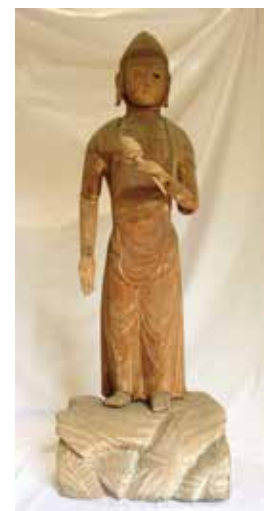
30. 西念寺 観音菩薩立像