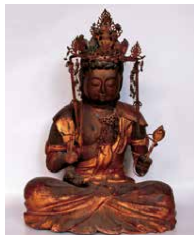
1. 松音寺・十一面観音菩薩坐像

このことは、本像の作ぶりからも窺えることであって、その うちぐ 内削りなしの一木造という古式の構造にもかかわらず、頭髮の波打つ毛筋や、厚い うわまぶた 上瞼に抑揚のある切れ長の眼による つや 艶めいた表情、癖のある衣文表現などに、鎌倉彫刻の理想主義が新来