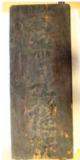
25. 永福寺 楠の名号