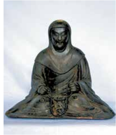
7. 永福寺・恵信尼坐像

恵信尼坐像（写真7）について。檜材を用いた頭・体共木で彫眼の一木造からなり内割りもない。以上の軀幹材に両肩から腕にかけての側面材および両袂を たもと 矧ぎ付け、これに裾先・袖口を含めた膝部横一材を接合し、両手首を袖口に挿し込む。彩色の痕跡がなく、当初から素地仕上げであったとみられる。頭巾を被り両手で数珠を執って静かに端座する思慮深い老女の姿が的確に表現されている。コンパクトな人物像の形態感や衣文表現の特徴などから、室町時代も15世紀代の製作とみられる。大正5年の ゆずりしようもん 譲証文があり、上記のようにもとは茨城県稲田（親鸞が越後配流の後、妻恵信尼とともに一時滞在した地）の西念寺に所在したもので、伝来の確かさを物語っている。