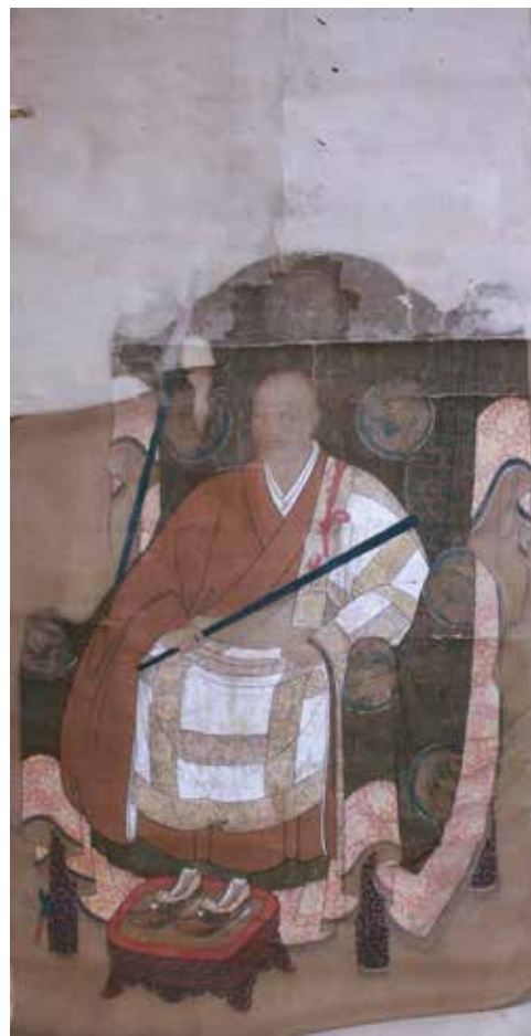
10. 松音寺・雪村友梅像

じる点が多く確認出来る。本図は友梅没後間もない頃に描かれたものと考えられ、南北朝時代14世紀後期頃の制作といえよう。県内でも数少ない中世に遡る肖像画のひとつである。