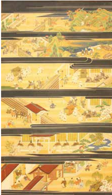
18. 親鸞聖人絵伝 第3幅