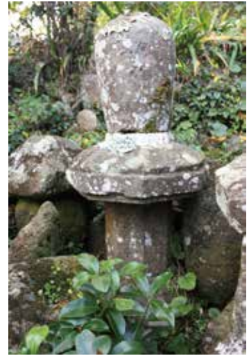
23. 松音寺 無縫塔②