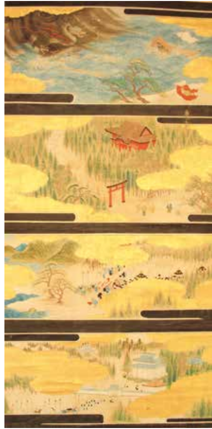
13.三国伝来観世音像八幡大神影嚮図 第2幅