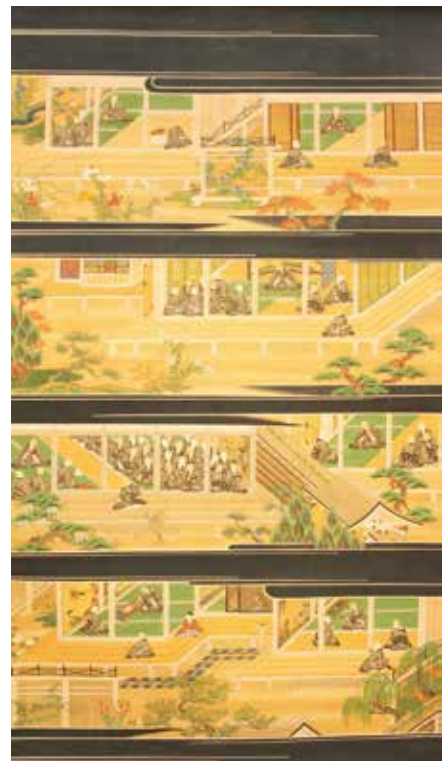
17. 親鸞聖人絵伝 第2幅