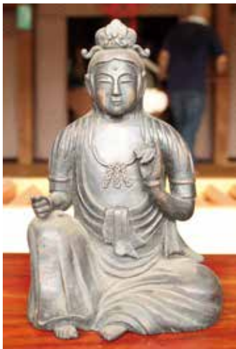
24. 曹源寺 如意輪観音坐像