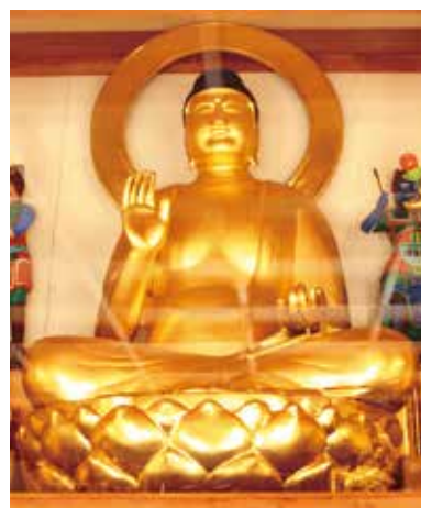
4. 曹源寺・薬師如来坐像

当寺の前身である道泉寺の旧本尊薬師三尊像である。これも近年の厚彩色で本来の作ぶりが損なわれているが、三尊に共通した両頬に膨らみをもたせた穏やかな円満相や、浅彫りの簡略な衣文表現、中尊薬師の小粒 らぼつ の螺髪を切り揃えた形の良い肉髻や両胸・腹部の膨らみを明瞭に表した厚みのある体貌、広大な膝張など、平安後期・12世紀代の和様彫刻の特徴を見せている。