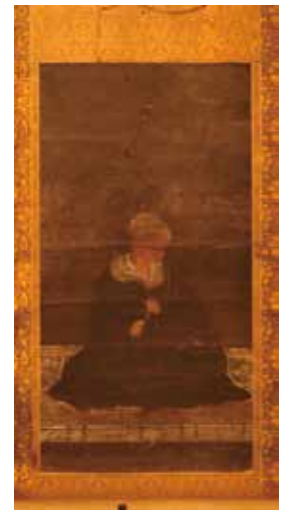
27. 永福寺 親鸞聖人像