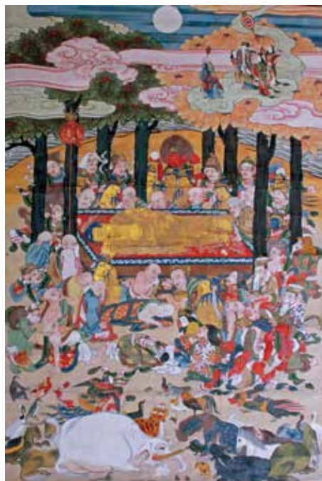
11. 松音寺・仏涅槃図

曹源寺には、もと円通寺の本尊であった如意輪観音像が安置される。本図は円通寺および円通寺の鎮守である八幡石垣神社の縁起を2幅にかけて描いたものである。第1幅には、円通寺の開山である浄蔵 じょうぞう が諸国行脚の途上で宇佐大神の化身である貴婦人に出会い、浄蔵に一字を建立すべき土地を示した場面。土地の人々に慕われた浄蔵が、当地の人々を悩ませていた焰渦巻く地獄原を鎮める場面を描く。第2幅には、第1幅から続き、やはり土地の人々を悩ませていた悪風を巻き起こす海中の龍を、法華經の功德により鎮める場面。承平5年（985）9月8日、念持仏であった如意輪観音を祀る石垣寺を落成し、鎮守として石垣八幡宮を建立した場面。延慶元年（1308）に大友貞親 おともさだちか が書写山貫主、堯勇 ぎょうゆう を招き「大慈山八幡圓通寺仁王院」として再興する場面が描かれる。