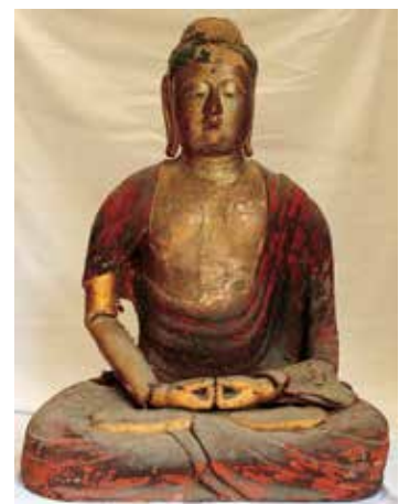
8. 西念寺・阿弥陀如来坐像

後世の厚彩色のため木組みの構造等不明瞭だが、基本的には頭・体共木の内割りのない一木造で、膝前部横一材を矧ぎ付け