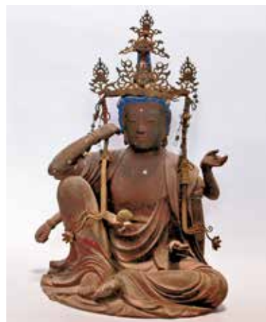
3. 宝満寺・如意輪観音坐像

像高24.9cmの小像のわりに細かな木組みをみせ、頭軀共木の一材に両側面材と膝部および六臂を ろつび 矧ぎ寄せ、裾先と髻にも別材を接合する。さらに面相部を割矧いで目に玉眼を嵌める。頭上の宝冠は銅板の透かし彫りで、随所に玉の付いた ようらく 璽珞を垂らす。卵型の面部に刻む小ぶりの目鼻立ちは、 しょうしや 瀟洒で涼やかな表情を表し、抑揚を抑えた体部の肉取りや細身の六臂などとともに、工芸的な形式美をみせている。このような作域から、本像の制作年代は、安土桃山時代から江戸時代もわりと早い時期に求められよう。