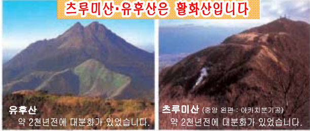
유후산 약 2천년전에 대분화가 있었습니다.