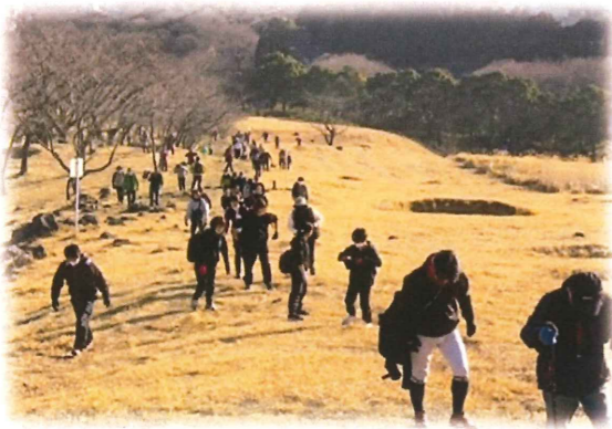
大平山ふれあい登山

朝日大平山地域に住む子どもから大人まで参加できる行事を実施しました。様々な団体と連携することで多くの参加者を呼び込み、多くの笑顔に包まれました。協議会を含め、多くの方々の力により、交流の機会や活動参加への「キッカケ」づくりを実施していきます。