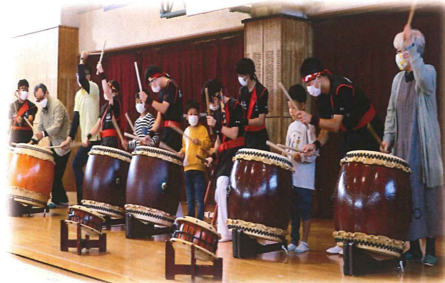
公民館との連携事業(伝統楽器の体験・交流)