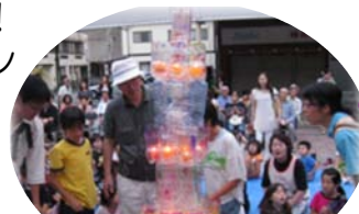
キャンドル点火の様子