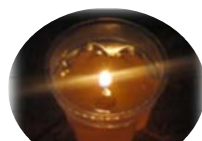
廃油から作った エコキャンドル

6月22日(土)午後の6時半から8時まで、楠銀天街とポケットパーク内にて不要な電気を使用せずに必要最低限の灯りの中で過ごす「キャンドルナイト2013」を行いました。 キャンドルの灯りの中で各種催しを楽しみ、日頃使用している 電気の大切さ についてみんなで考えることが出来ました！ 皆さんも夏至の日やクリスマスなどの特別な日は、キャンドルの灯りの中でゆったりと時間を過ごしてみませんか？