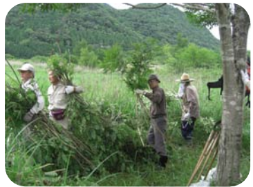
イタチハギの除去

この湿原の環境にしか生育できない植物を保護するため、自然保護団体「猪の瀬戸湿原保全の会」が地道な保全活動を通して希少野生植物を保護しています。