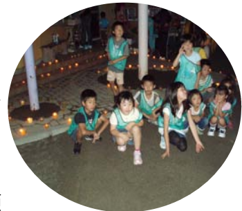
エコクラブのメンバー（一部）

6月19日（土）に「やまなみ保育園（竹の内）」でキャンドルナイトが行われました。参加者は「こどもエコクラブ※」に所属する、保育園児から小学生の約50人。自作した300個もの「廃油キャンドル」の光が揺らめく幻想的な雰囲気の中で、「クイズ」や「人形劇」を通して環境について学んでいました！