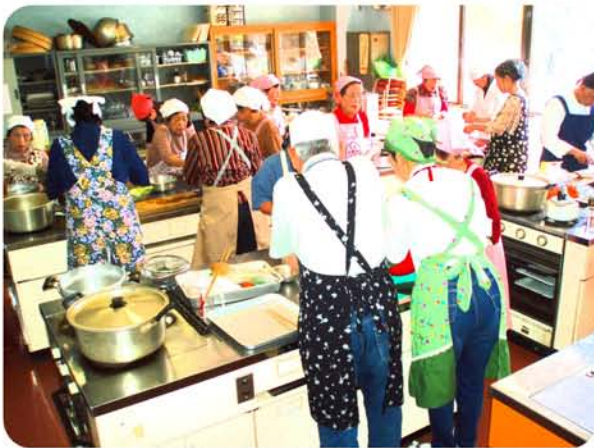
エコ・クッキング中

調理工程で水をできるだけ使わないようにして、手際よく料理されていました。食材も余すことなく使うことで、調理くずがほとんど出ないことにも驚きました。調理の空き時間に、調理器具が洗われる様子にも注目。油を使用していないため水洗いで十分で、よごれの落ちにくいものは最後に洗われていました。