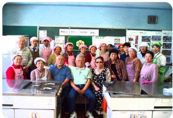
今回のエコ・クッキング参加者

地産地消…遠距離輸送によるエネルギーの消費やCO2の排出を抑えるとともに、農産物を輸出している国の水資源を、大量消費することの抑制にもなります。