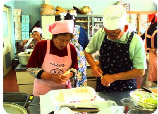
郷土料理のやせうま作り

今回はエコ・クッキングを実践されている、別府市食生活改善推進協議会（以下、食推協とする）に密着取材いたしました。約20名のヘルスメイトが集まり、公民館や地区の催し物に出て子供や学生さんに食育しています。水を大切にする、食材を無駄にしない、地産地消をコンセプトとし、昭和57年頃から活動しています。