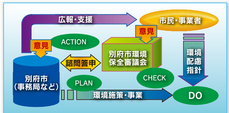
図2：計画の推進体制