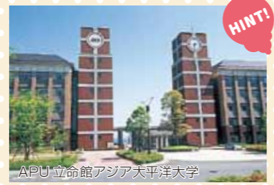
APU 立命館アジア太平洋大学