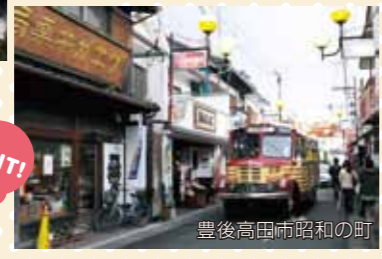
豊後高田市昭和の町

商店街の再生事例昭和の町(豊後高田市)、全国にひろまりつつあるオンパク手法(別府市)