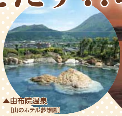
▲由布院温泉 [山のホテル夢想園]

「会場が温泉地というだけで参加者の顔がほころびます。」との声を聞きます。 開催地の選定で会議の魅力をグッと増すことができます。 いつものオフィス街から場所を変え、自然と笑顔がはじけるおんせん県でMICEを開催してみませんか。 充実した施設と運営能力はもちろん、日本一の「温泉」そして山海の豊富な「食」は癒しの象徴…癒しは活力の根源… おんせん県MICEは会議に活力を生み出します。