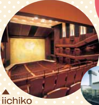
▲iiichiko 総合文化センター [大分市]

大規模集会の会場としても利用できる40,000人収容可能なスタジアム。2002年にFIFAワールドカップを筆頭に国際級のスポーツ大会、トップアーティストのコンサートなどの実績があり、天候に左右されない開閉式屋根が特徴です。