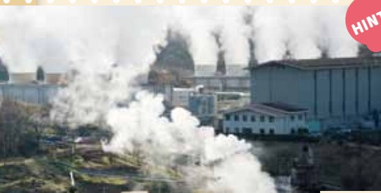
八丁原地熱発電所