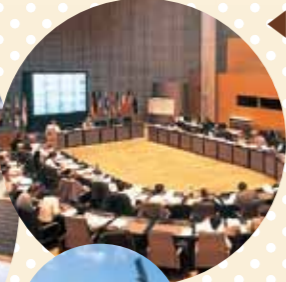
◀別府国際 コンベンションセンター B-ConPlaza [別府市]

西日本最大級のコンベンション施設。1万人の国際会議・学会・大会からコンサート、プロスポーツイベントまで、充実した施設とスタッフで幅広く対応可能です。