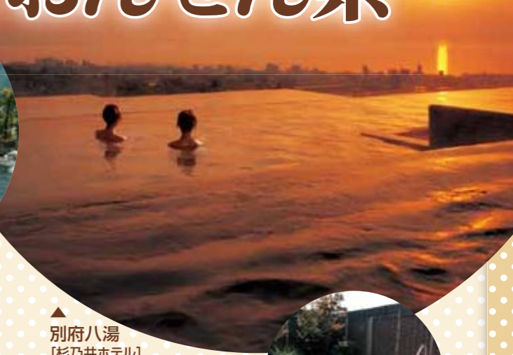
▲別府八湯 [杉乃井ホテル]