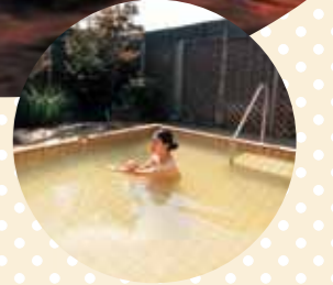
▲大深度地熱温泉 [大分市・丹生温泉]

大分県は日本一のおんせん県。10種類の泉質に加えて、マッサージ効果のある打たせ湯、発汗を促しほどよい指圧効果のある砂湯、薬草を敷き詰め天然サウナの蒸し湯、泥のバックでつや肌効果のある泥湯。打たれて、かけて、蒸されて、塗って… ストレスフリーの温泉効果で明日への活力を生み出します。