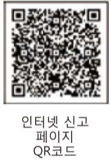
인터넷 신고 페이지 QR코드