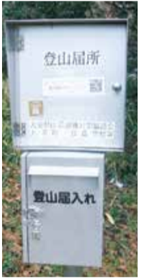
( 신고서기입대설치 예 )