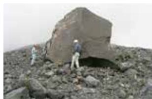
큰 분석 (2005년 아사마산)