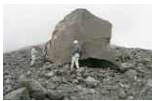
大飞石(2005年浅间山)