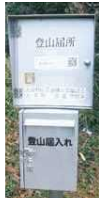
(登山申请记录台的设置实例)