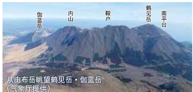
从由布岳眺望鹤见岳·伽蓝岳

别府市街背南北延伸5公里范围内，是连接岩浆穹窿的火山群。鹤见岳位于其南端，伽蓝岳位于其北侧。